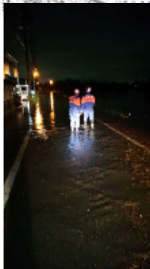
五六ふれあい橋西側 牛牧1573番地1地先 8日 2:00頃