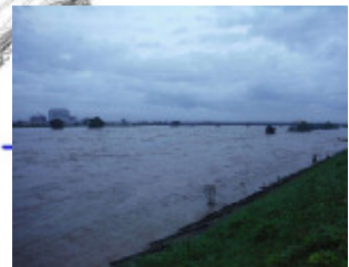
長良川下流を望む (国道21号) 8日4時30分頃