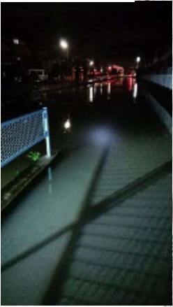
牛牧団地北 都市下水路管理道路 牛牧1258番地4地先 8日 1:50頃