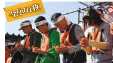
今年の1枚 過去のふれあいフェスタの様子