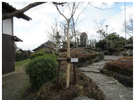
イロハモミジ（令和 2 年 1 月植樹）