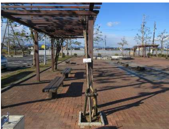
藤ノ木（令和元年 10 月植樹）