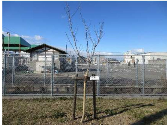
サクラ（令和元年 10 月植樹）