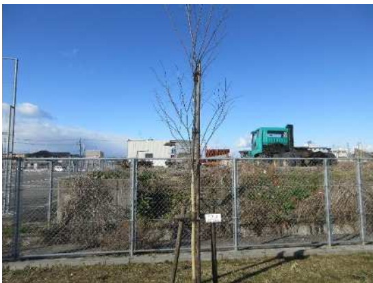
ケヤキ（令和元年 10 月植樹）

岐阜県緑化推進委員会から募金額の一部を事業費としていただき、緑化推進事業として生津スポーツ広場にケヤキとサクラを1本ずつ、中ふれあい広場へ藤ノ木を1本植樹しました。また、小簾紅園にて枯死したモミジの植替えも行いました。