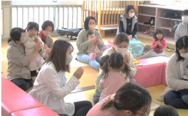
♪ちいさなにわをよくたがやして〜