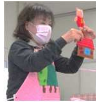
エプロンシアター 【3びきのこぶた】