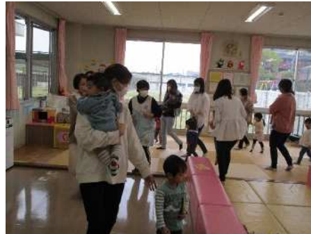
♪まてまて まてー！ つかまえちやう ぞー！