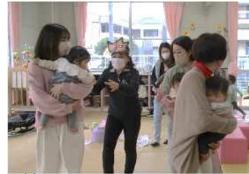
親子ふれあい遊び 【おおかみごっこ】