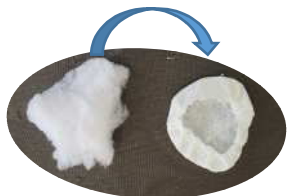
(モミモミ！ギュギュ！)