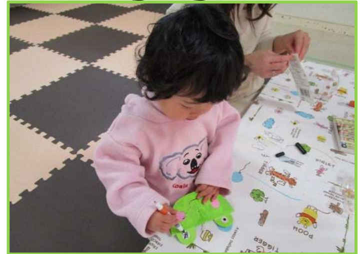
かわいいカエルさんができた！