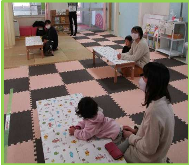
ソーシャルディスタンスで安心スペース

中に何が入っているかな？シールやテープを貼ると楽しいね。どんな楽器ができるかワクワク！