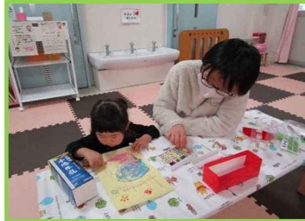
牛乳パックに貼るよ。お絵かきに夢中！