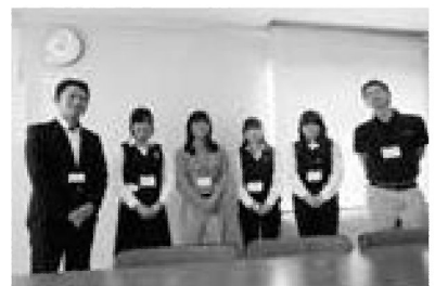
▲広瀬社長 (写真左端)

過去の記事や男女共同参画に関する取り組みについて、詳しくはこちらからホームページをご覧ください。