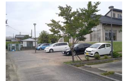
職員の駐車場状況

◆ 施設の職員は、建物の東側の余剰スペース(砂利)に駐車しており、施設の駐車場は、利用者用に開放していますので、ご理解をお願いします。