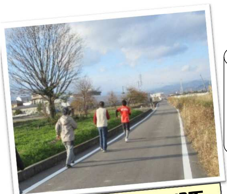
ウォーキング教室の一場面