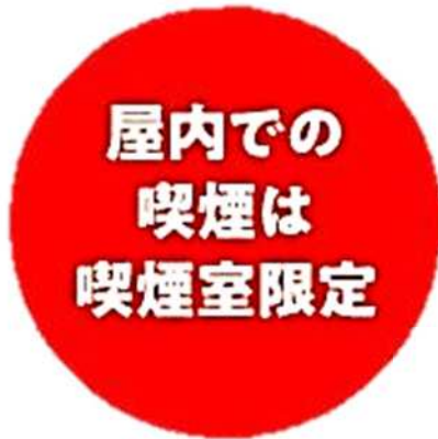
屋内での喫煙には 喫煙室の設置が必要に