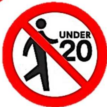
20歳未満のかたは 喫煙エリアへ立入禁止に