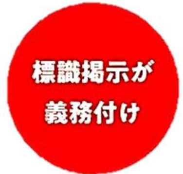
喫煙室には 標識掲示が義務付けに