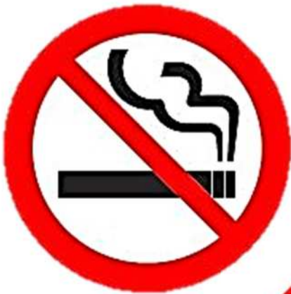
多くの施設において 原則屋内禁煙

2020年4月：飲食店やオフィス・事業所などでも、原則屋内禁煙となるほか、20歳未満のかたの喫煙エリアへの立入禁止などを加えた改正健康増進法が全面施行されました！