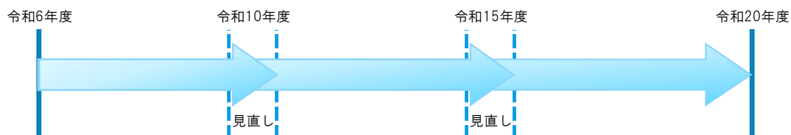
図 1-2 計画の期間