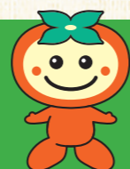
瑞穂市マスコットキャラクター かきりん