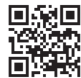
瑞穂市ホームページ