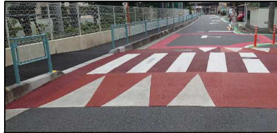
スーズ横断歩道 (ハツ)