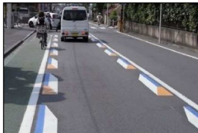
狭さく (立体的な路面標示)