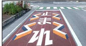
止まれ強調 (路面標示)