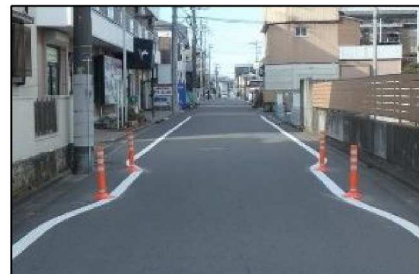
狭さく (ポストコーン)