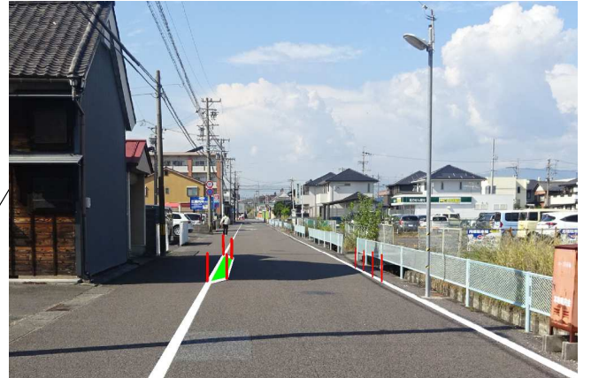
シケイン（クランク）