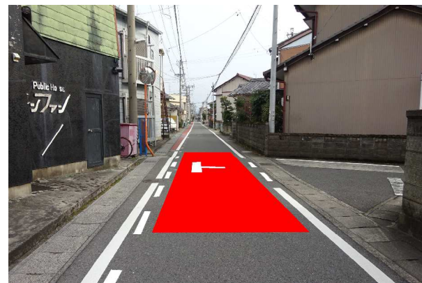
交差点カラー舗装