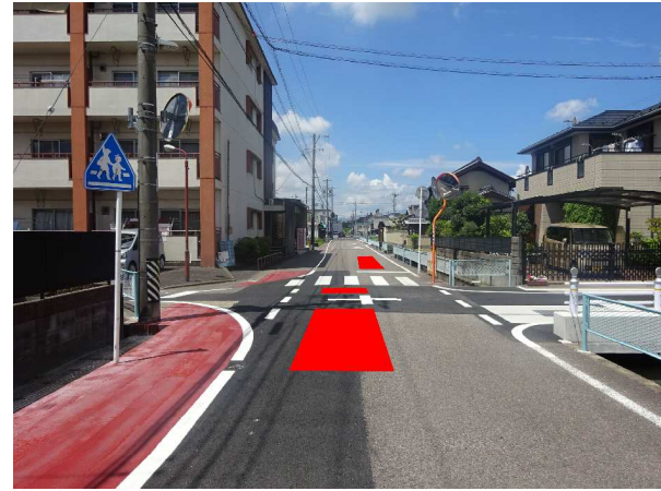
交差点カラー舗装 （横断歩道あり）