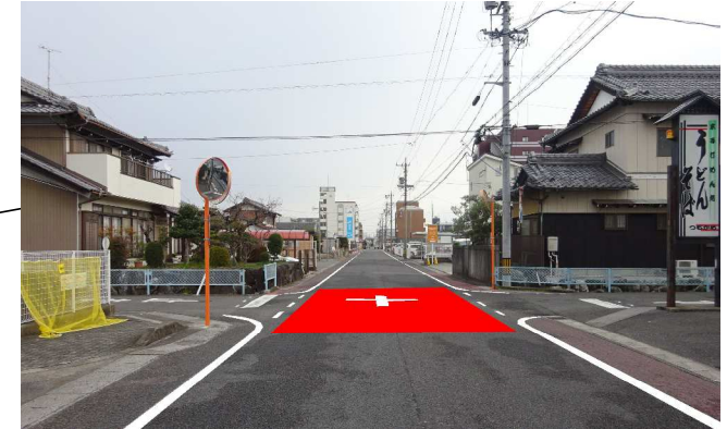
交差点カラー舗装