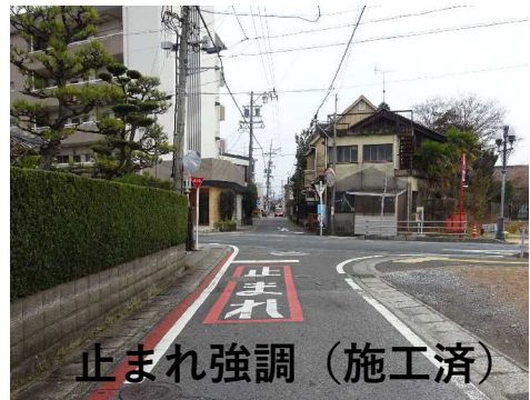
止まれ強調（施工済）