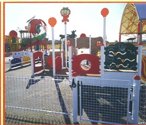
複合遊具(3歳未満向け)