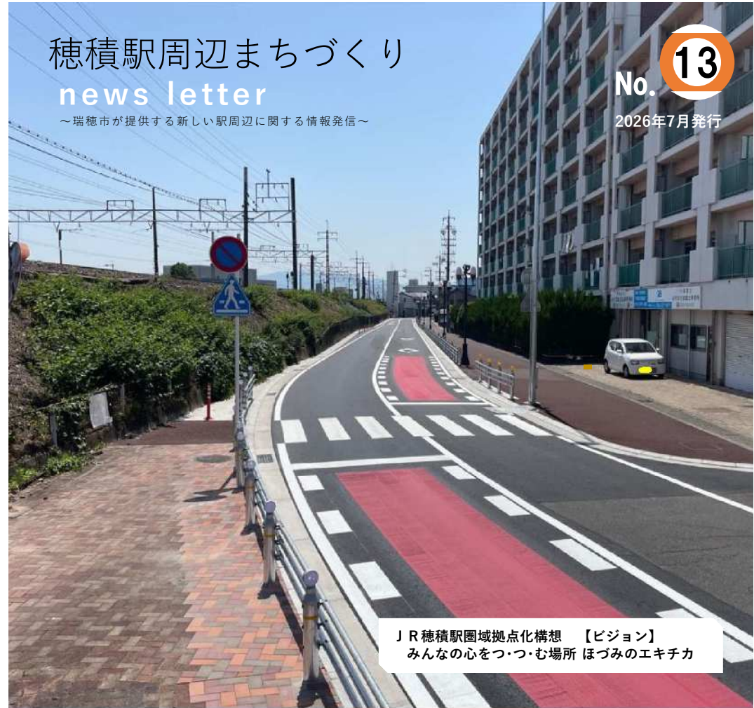
JR穂積駅圏域拠点化構想 【ビジョン】 みんなの心をつつむ場所 ほづみのエキチカ

「穂積駅周辺まちづくり ニュースレター」は、駅周辺のまちづくりに関する検討の内容や進捗の状況をお届けしていきます。