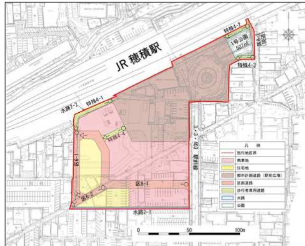
※現段階の計画であり、変更となる可能性があります。