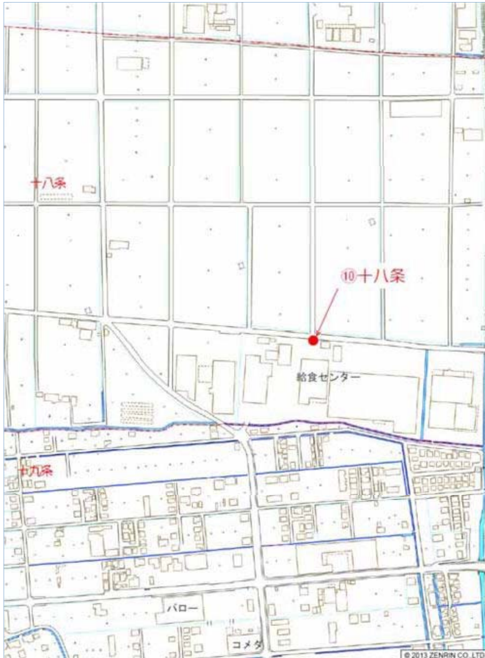
⑩ 十八条 (給食センター 北側)