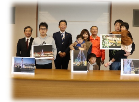
<エキサイトイルミの表彰式>

エキサイト賞、瑞穂市長賞、商工会長賞の計5作を選出しました。表彰式では、受賞者の皆さん、エキサイトの役員の皆さん、瑞穂市長、商工会長をお招きしました。