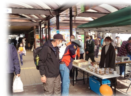
<よってみい市の様子>