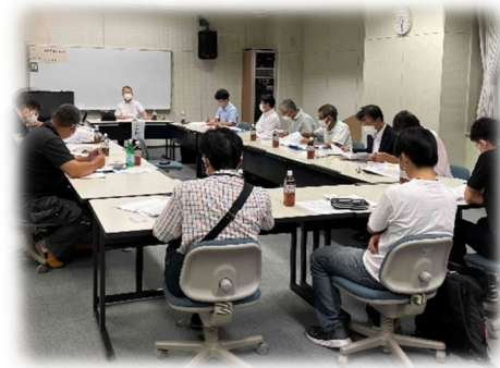
<エキサイト会議の様子>