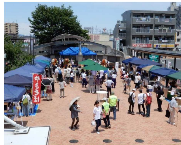
駅前広場での出店イベント