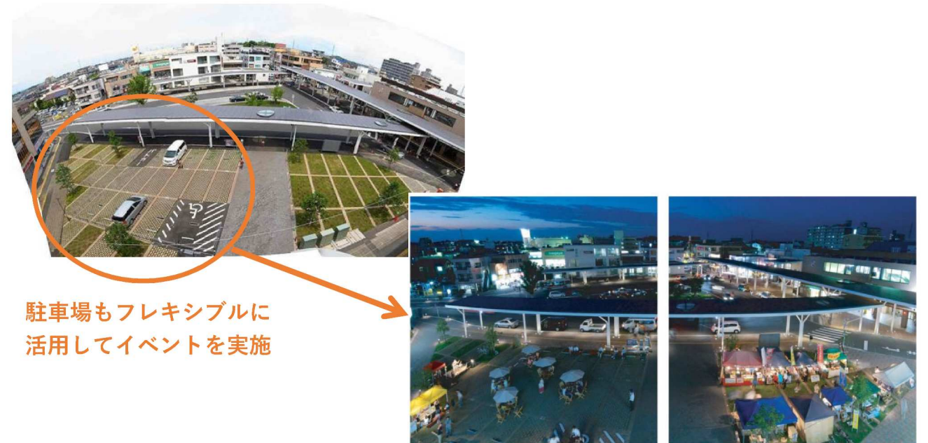
駐車場もフレキシブルに活用してイベントを実施