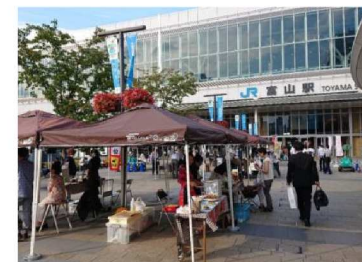
地域特産物の販売イベント