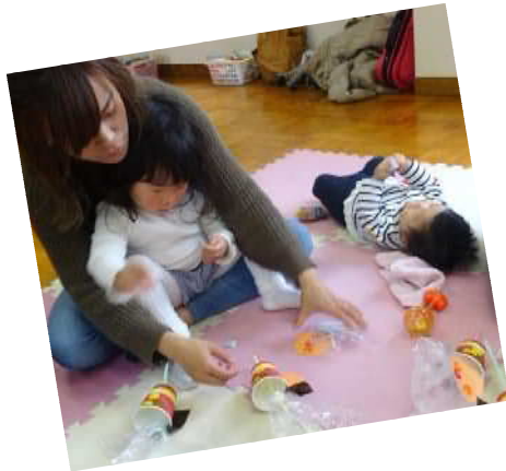
シールを貼ってアンパンマンを完成させるよ！