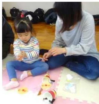
吹くことは言葉の発達にとってもいいことだね。