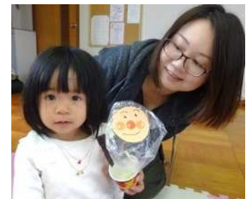
ストローでフーッとできるかな！？