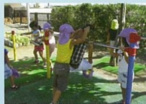
うんどう ちょうせん 運動に挑戦する