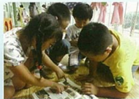
ことば つた あ 言葉で伝え合う