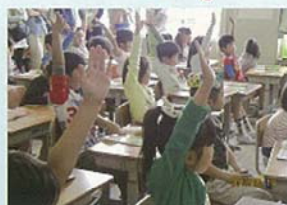
かんが ほうびょう 考えを発表する