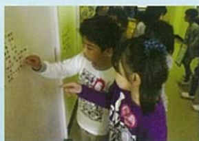
し しろ 知りたいことを調べる