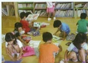
えほん ふ 絵本に触れる