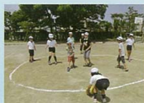
なかま うんどう 仲良く運動する