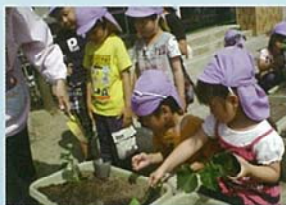
とも いっしょ おこな 友だちと一緒にやる