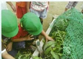
やさい せいちょう よろこ 野菜の生長を喜ぶ