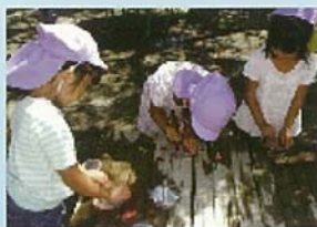
くふう 工夫してやってみる