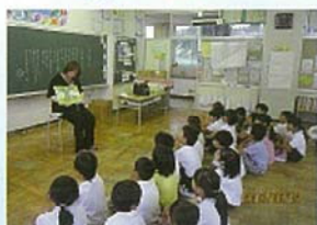
ほん した 本に親しむ