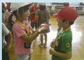
おお なかま べんきょう 多くの仲間と勉強する