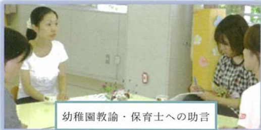
幼稚園教諭・保育士への助言

保育参観を通して、子どもたちの発達を理解した保育や、一人一人に合った適切な支援ができるよう、専門的な助言をしています。