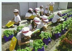
しょくぶつ かんさつ 植物の観察をする