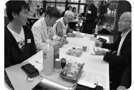
▲①意見交換会の様子