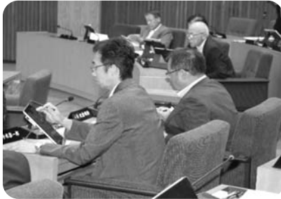
▲③タブレット端末の導入

③タブレット端末の導入については、岐阜地域の議会で最初に導入することができ、ペーパーレス化、会議の効率化、情報の共有・迅速化を図ることができました。