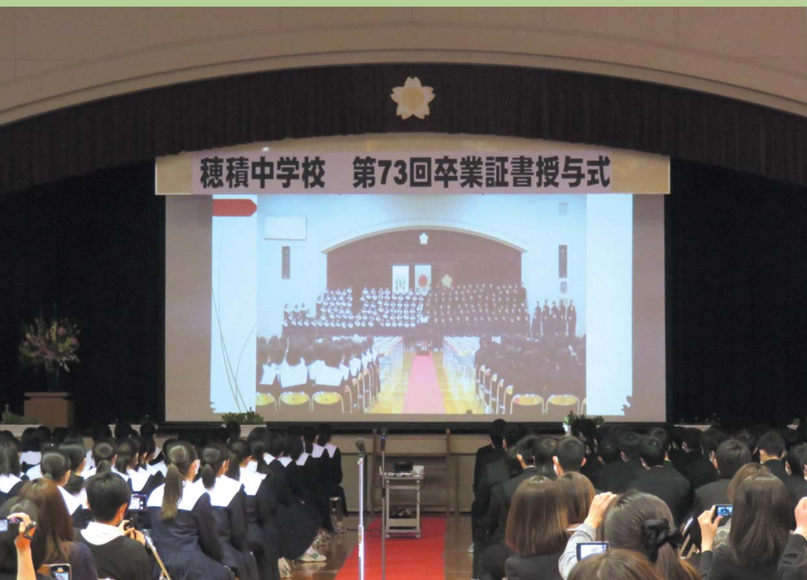
▲新型コロナウイルス感染症対策をされた穂積中学校卒業式