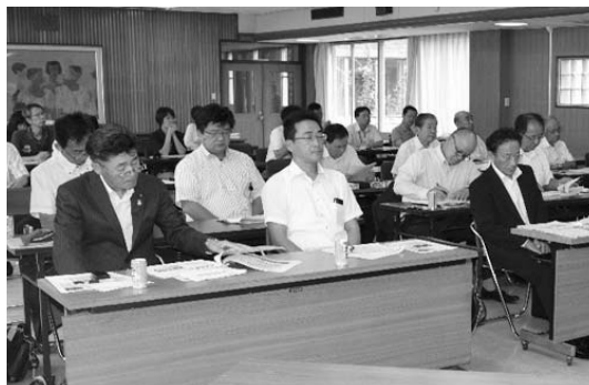
▲平成29年度議員研修会の様子