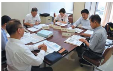
▲編集委員会の様子