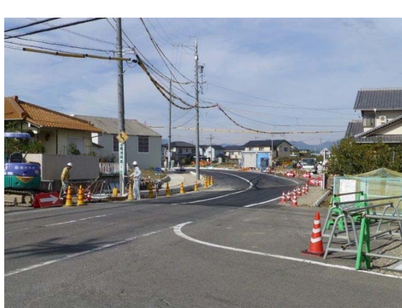
市道13-30号西部環状道路状況