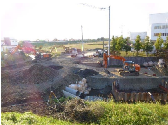
犀川・宝江地区を結ぶ橋梁新設箇所確認