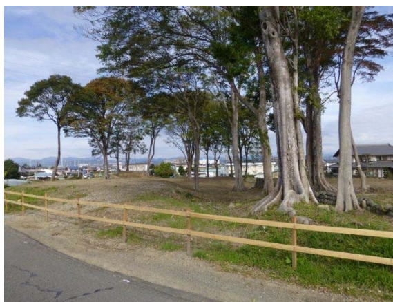
野白公園現在状況