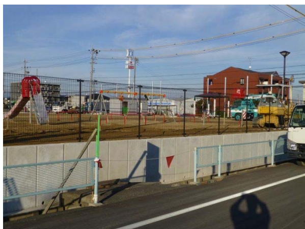
牛牧公園現在状況