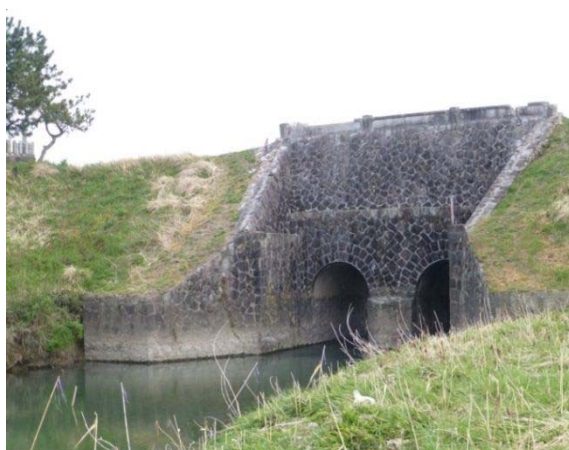
牛牧閘門の五六川改修確認